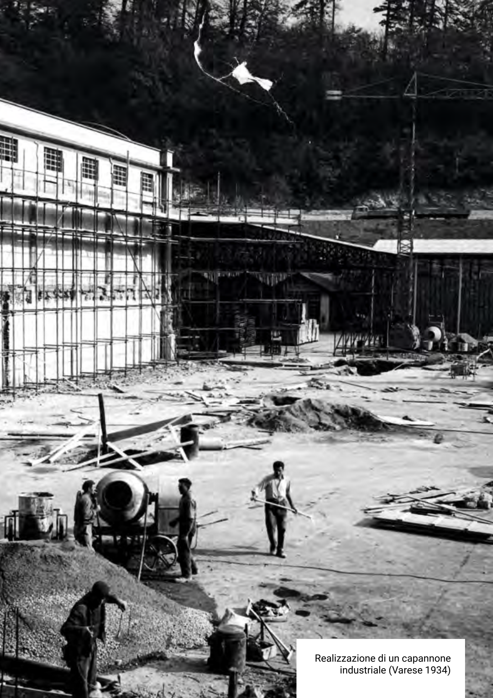
Realizzazione di un capannone industriale (Varese 1934)